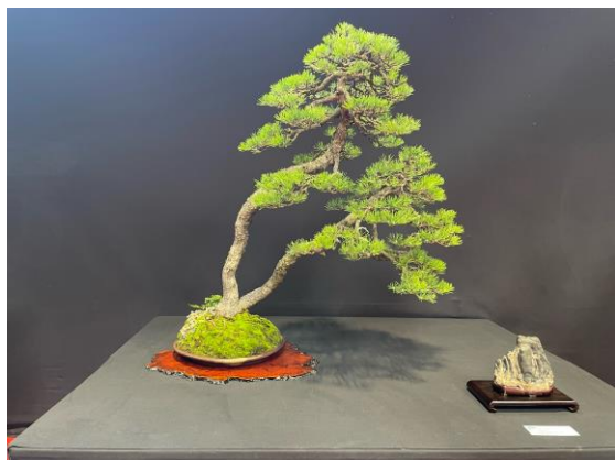
Pinus nigra var. corsicana de Michel Esseiva (Dijon Bonsaï Show)